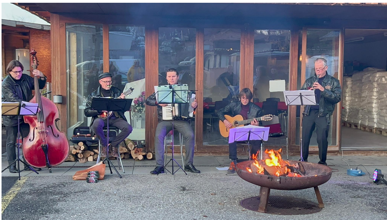
Bild: Musik an der Vollversammlung Standplatz Bern-Buech