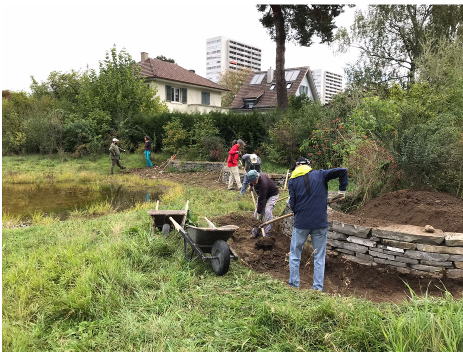
Bild: Aktion Verein Natur Bern West am Herbstmärt