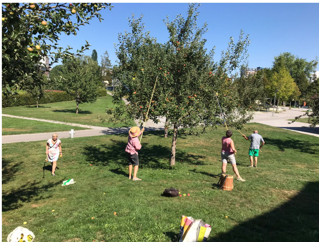
Obstpflücktag im Brünnengut